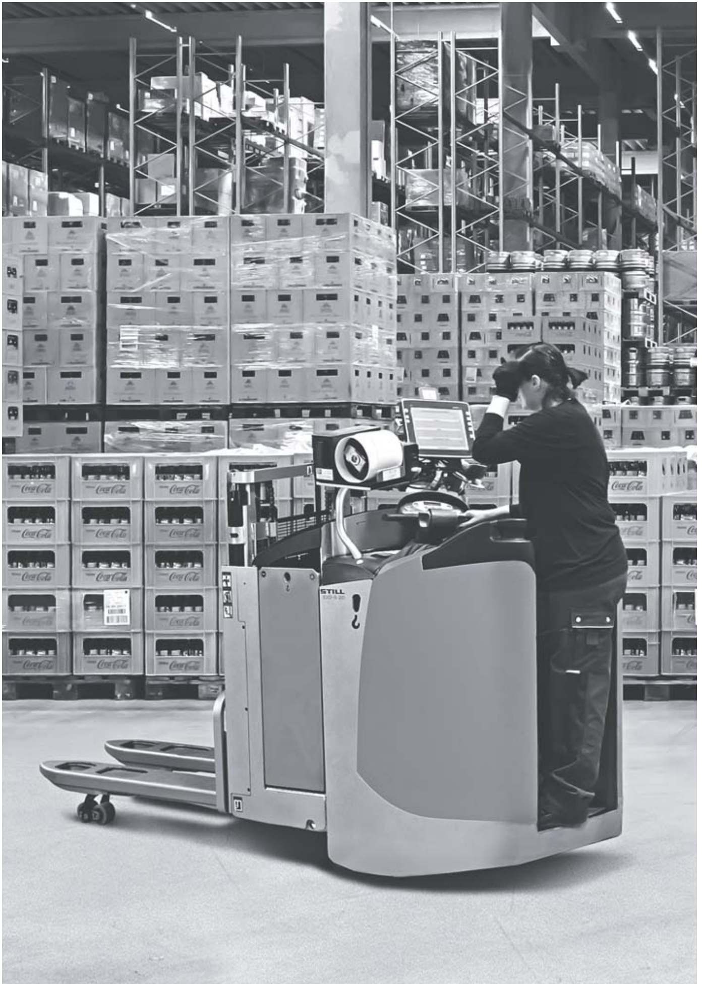
EXD-S Gerbeur à double niveau et plate-forme Toujours deux palettes d'avance